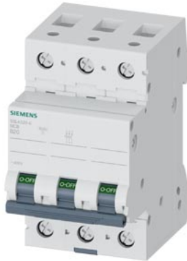
Leitungsschutzschalter 400V 10kA, 3-polig, B, 20A