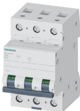
wyłącznik nadmiarowo-prądowy 400 V 10 kA, 3-bieg., B, 32 A