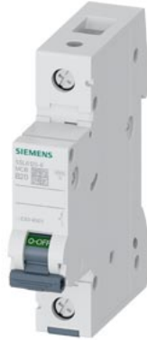
Leitungsschutzschalter 230/400V 6kA, 1-polig, B, 20A